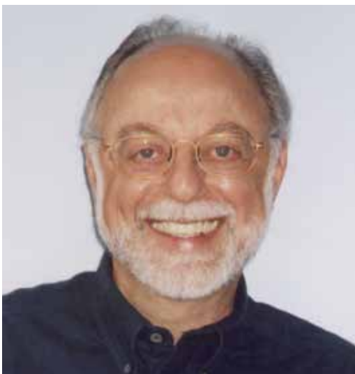
Fred Alan Wolf

alsof ik van de ene werkelijkheidslaag naar de ander afdaalde. Na een poosje dacht ik dat ik weer wakker was geworden en gewoon in bed lag, maar ik merkte tot mijn verbazing dat ik nog altijd sliep. De kamer waarin ik was ontwaakt, was een droomkamer. Toen realiseerde ik mij dat ik hoewel ik nog sliep, wakker was geworden in mijn droom. ... Elke keer als ik wakker werd, zag ik een levensechte wereld waarin dingen gebeurden, alleen speelde ze zich in een duizelingwekkend snel tempo voor mijn ogen af.