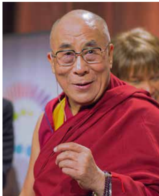
Tenzin Gyatso, de 14e Dalai Lama